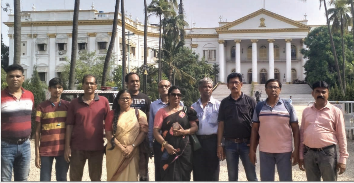
রাজ্যপালকে স্মারকলিপি প্রদান

Newspaper Registration No. R.N. 42029/81 New Postal Registration No. SSRM/ KOLRMS/WB/RNP-122/2015-16