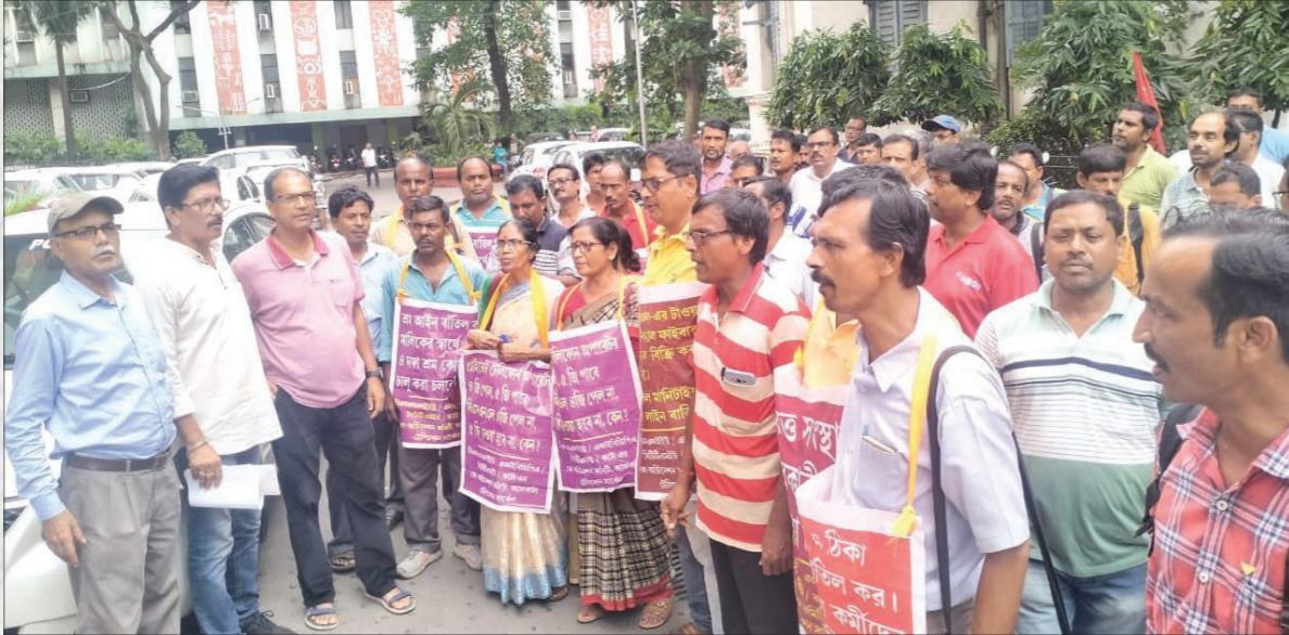
নিজাম প্যালেসে বিক্ষোভ